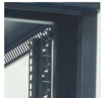
► Soportes de fijación verticales con identificación de unidades de Rack.