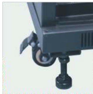
► Ruedas con freno y niveladores.